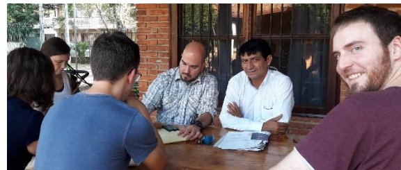
Visa-Hilfe durch Notar