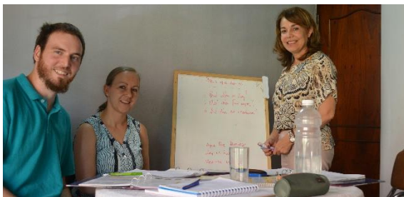
Spanisch-Unterricht mit Lehrerin

Bei uns hat sich mit unserem Umzug nach Paraguay sehr viel auf einmal verändert: Land, Leute, Sprache, Kultur, Klima – das gesamte Umfeld. Es hat einige Zeit gedauert, bis wir mit diesen vielen Veränderungen auf einmal klar kamen. Mittlerweile haben wir etwas Routine. Sich richtig einzuleben kann Jahre dauern, wie wir von Kollegen gehört haben. Wir wollen euch etwas mit hineinnehmen in unsere Erlebnisse der letzten Wochen und Monate.