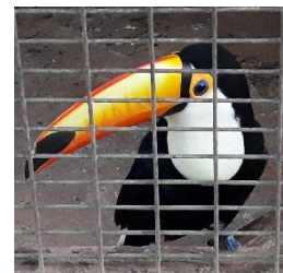
Tukan im Asuncióner Zoo