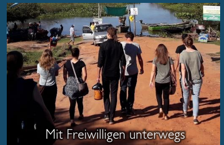
Mit Freiwilligen unterwegs Asunción, 27. Juni 2018