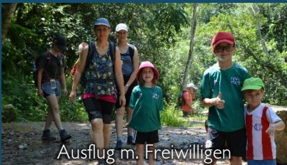
Ausflug m. Freiwilligen