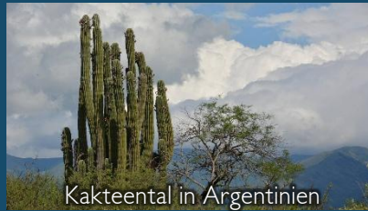
Kakteental in Argentinien